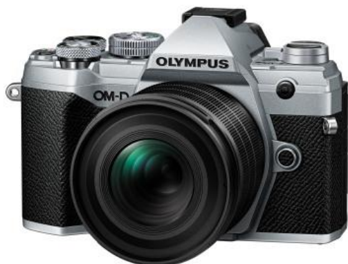
「M.ZUIKO DIGITAL ED 20mm F1.4 PRO」 （「OLYMPUS OM-D E-M5 Mark III」装着時）