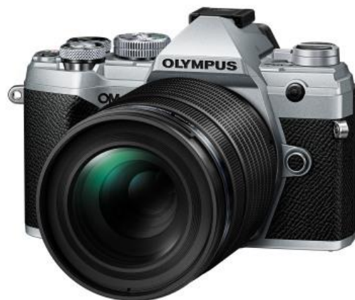
「M.ZUIKO DIGITAL ED 40-150mm F4.0 PRO」 （「OLYMPUS OM-D E-M5 Mark III」装着時）